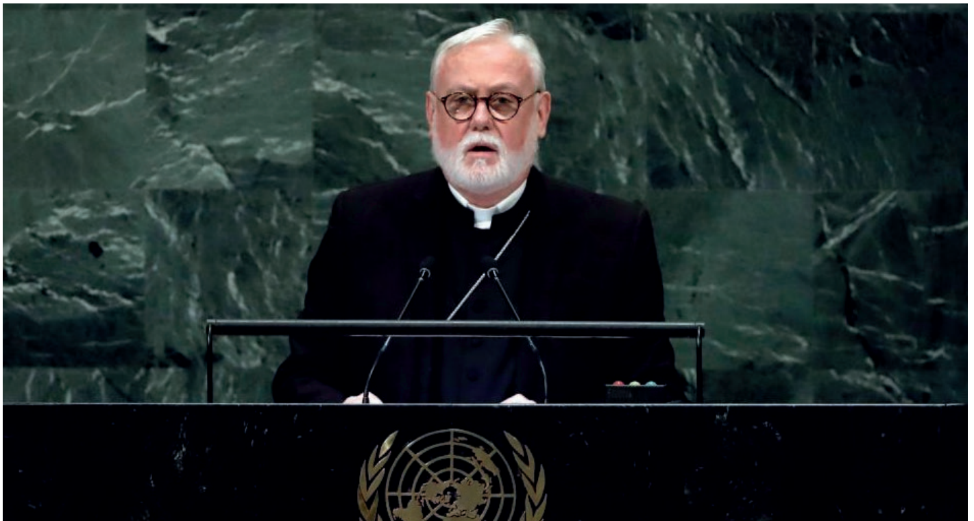
L'arcivescovo Paul Richard Gallagher, segretario per i Rapporti con gli Stati della Santa Sede, durante un intervento alle Nazioni Unite

LA DIPLOMAZIA VATICANA AGISCE PER FACILITARE LA PACE TRA LE NAZIONI