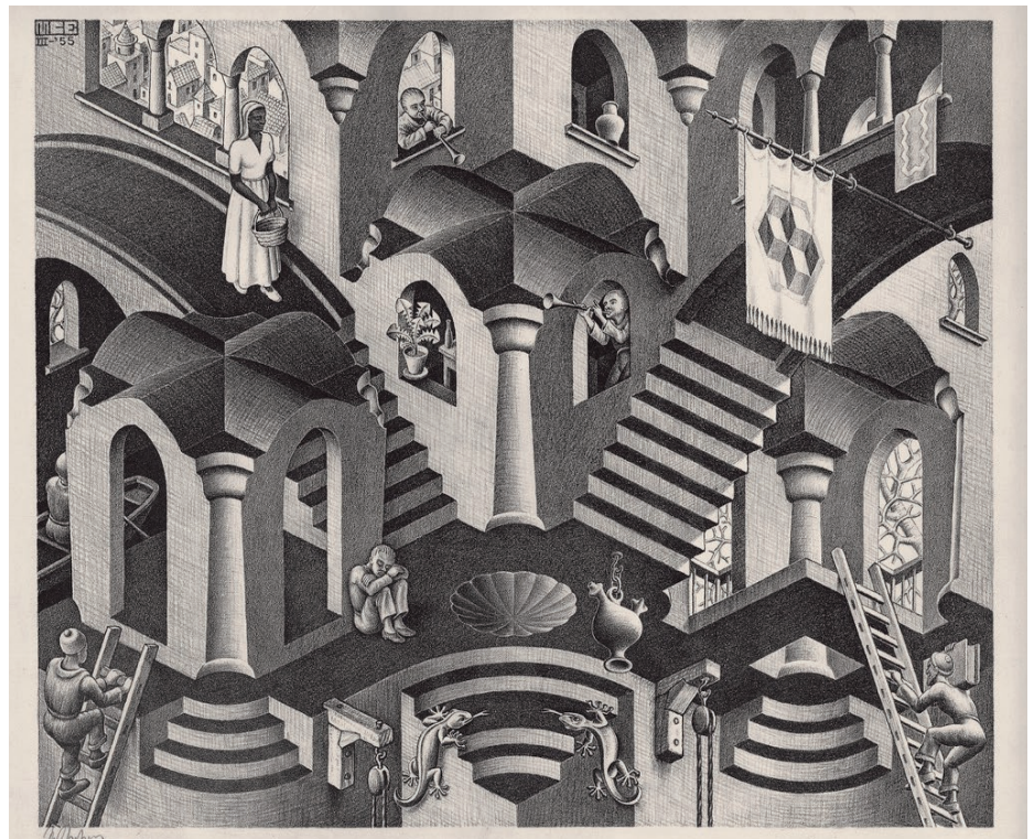
Maurits Cornelis Escher, «Concavo e convesso» (1955)

DALLA CONVENZIONE DI FARO AL PROGETTO STEPS